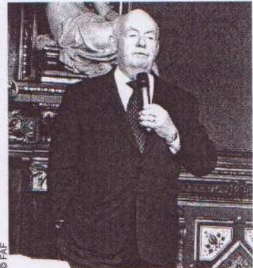
M. John Sweeney, Président de l'American Federation of Labor and Congress of Industrial Organizations (AFL-CIO) lors de la Conférence « Facing 2004 Challenges : Elections, Unemployment and Globalization ».